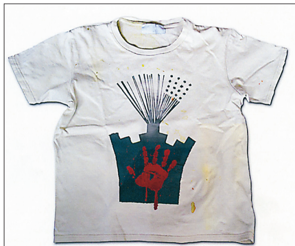
Tröja i protest mot Shahen och militärdiktaturen.

Natten den femte mars 1989 brände fyra elever, på en högskole-skola i Västervik, ner sin egen skola. Kring denna dramatiska händelse