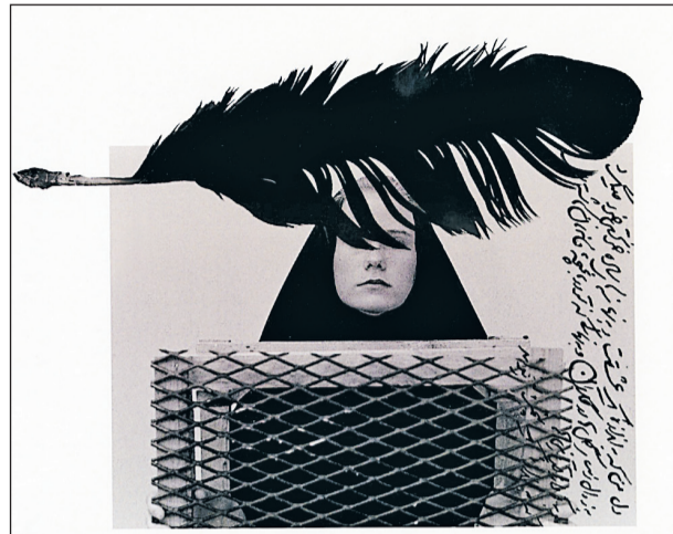
Forugh Farrokhzad (1935-67) var iransk poet och filmregissör. Hon skrev dikten med inledningsorden: "På nytt skall jag hälsa solen...".

– Jag kunde helt enkelt inte bära vapen och som straff för detta blev jag deporterad till byn Ivage, långt ut på landsbygden. Här upplevde