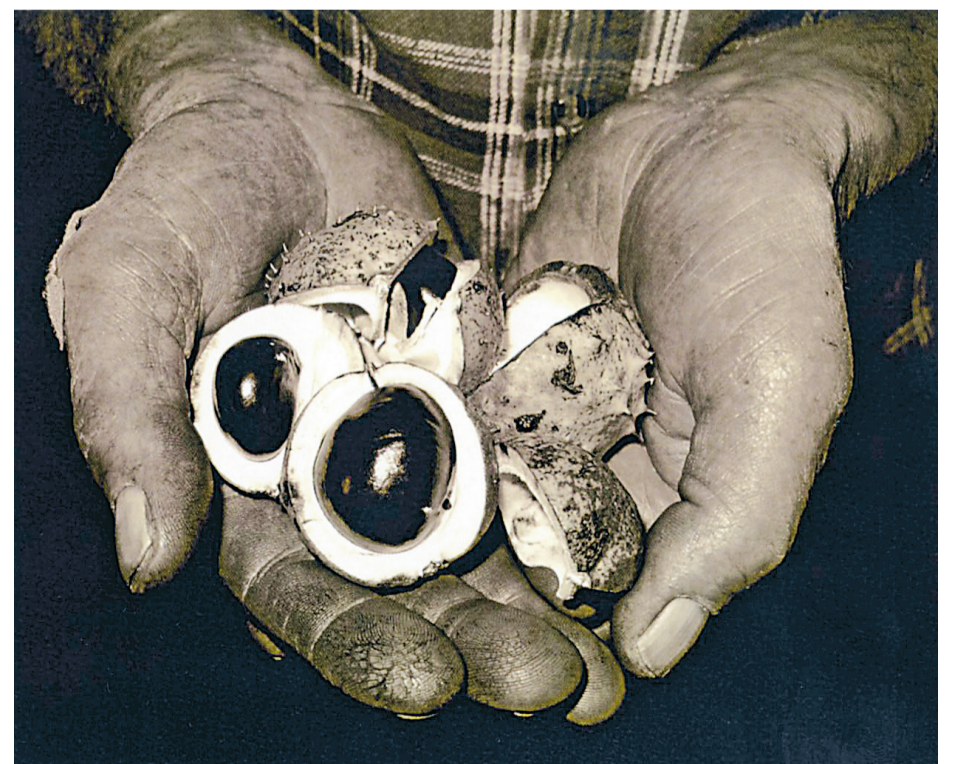
En bondes slitna händer visar upp vackra glänsande kastanjer, en viktig handelsvara.